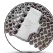
AJUSTE DE BROCHE