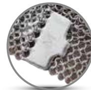
AJUSTE DE BROCHE