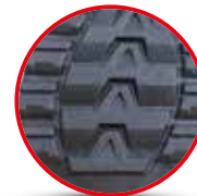
PLANTA ANTI DESLIZANTE