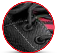
FUELLE DESCARNE GAMUZADO